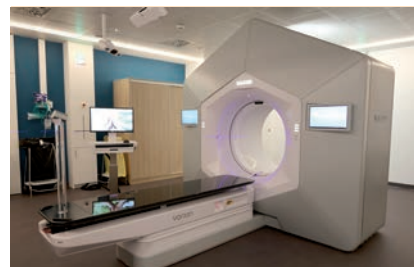
Radiothérapie (Halcyon, CyberKnife®), IRM...